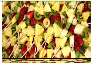
Obst-/Gemüsespieße 0,30 ct.